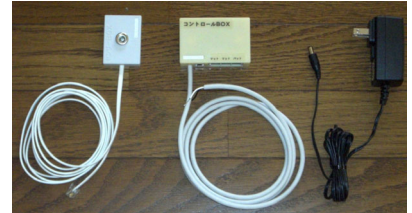
付属品 いずれの商品にも、センサーBOX、コントロールBOX、ナースコール接続用ジャック、電源アダプタなどの付属品が必要です。