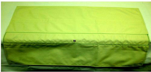
ケアマット (タッチセンサー「ベッドサイドタイプ」) マットレスの端に敷くタッチ式センサーです。 ベットの端に触れると反応して離脱・離床をお知らせします。 サイズ：横800mm×縦460mm