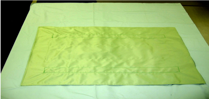
ケアマット (起き上り反応センサー「スタンダードタイプ」) マットレスとシーツの間に敷くシート感覚のセンサーです。 起き上って離床した時に反応してお知らせします。 サイズ：横1000mm×縦700mm

高齢者介護施設においては既設ナースコールシステムのコンセントにつなぐだけで、直ぐにご利用できます。