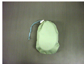
ケアパッド (タッチセンサー「ケアコールタイプ」) 指先等身体不自由な方でも身体の一部が触れただけで反応してお知らせします。 サイズ：横150mm×縦200×厚み50mm